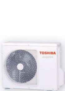
Venkovní jednotka (příklad)